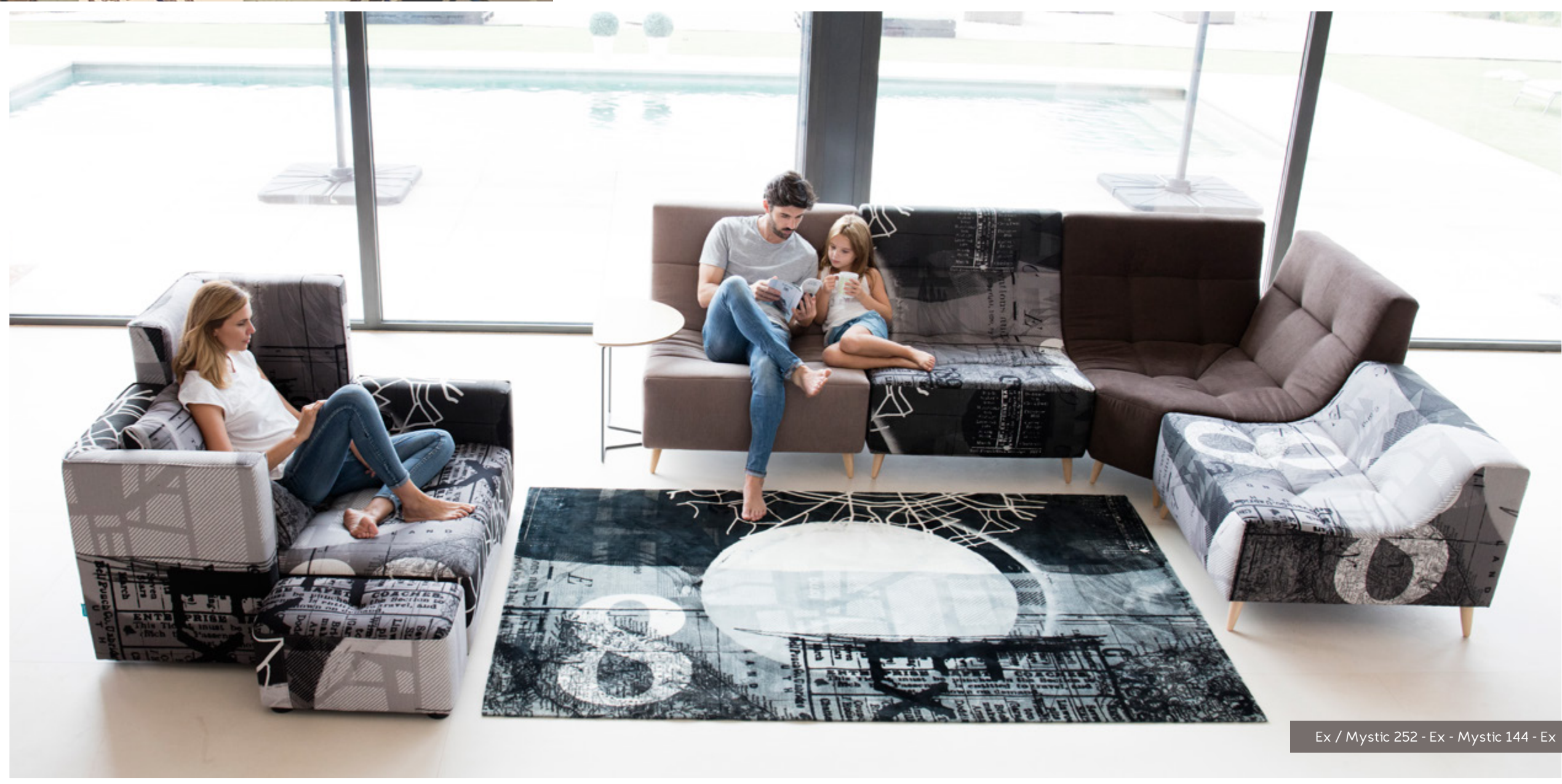
Ex / Mystic 252 - Ex - Mystic 144 - Ex