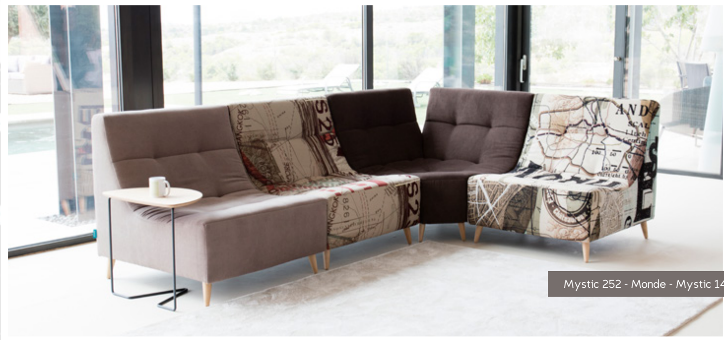
Mystic 252 - Monde - Mystic 144 - Maps