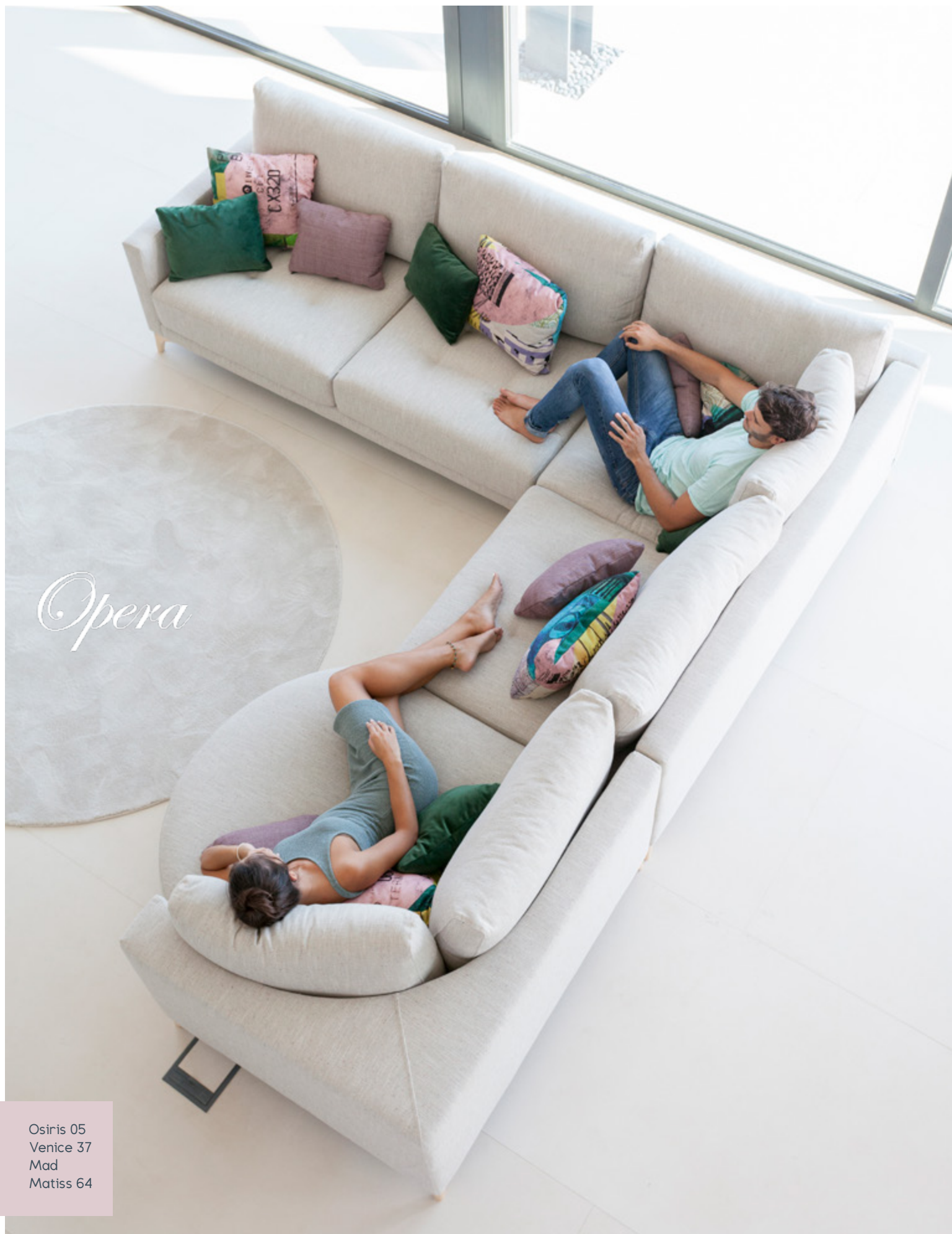
Osiris 05 Venice 37 Mad Matisse 64