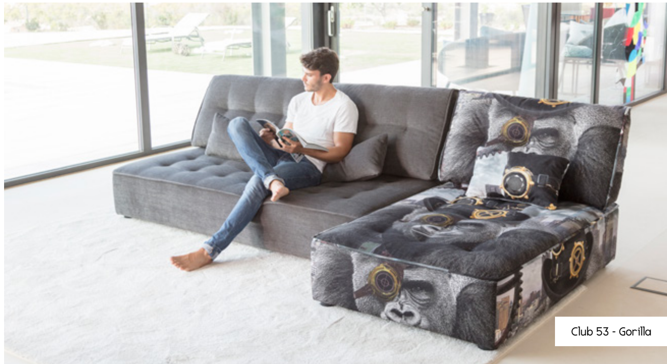
Club 53 - Gorilla