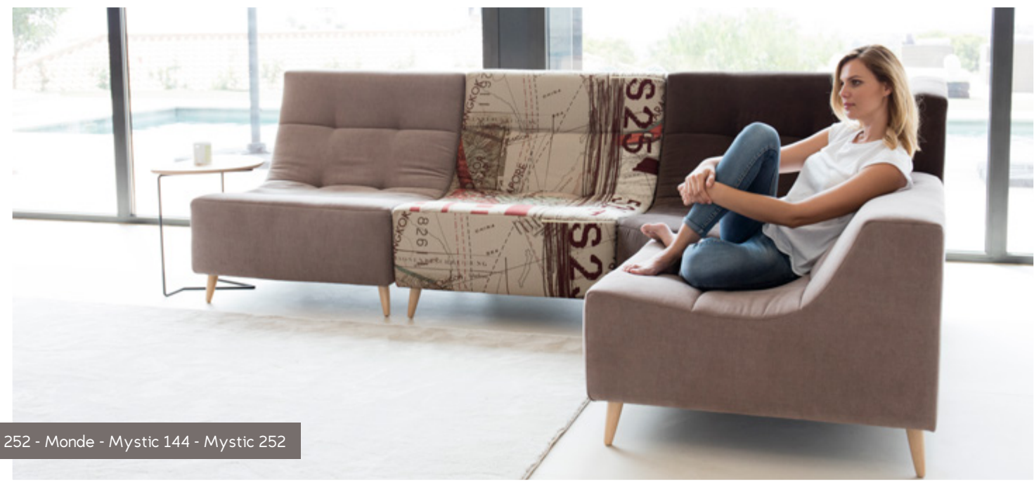
Mystic 252 - Monde - Mystic 144 - Mystic 252