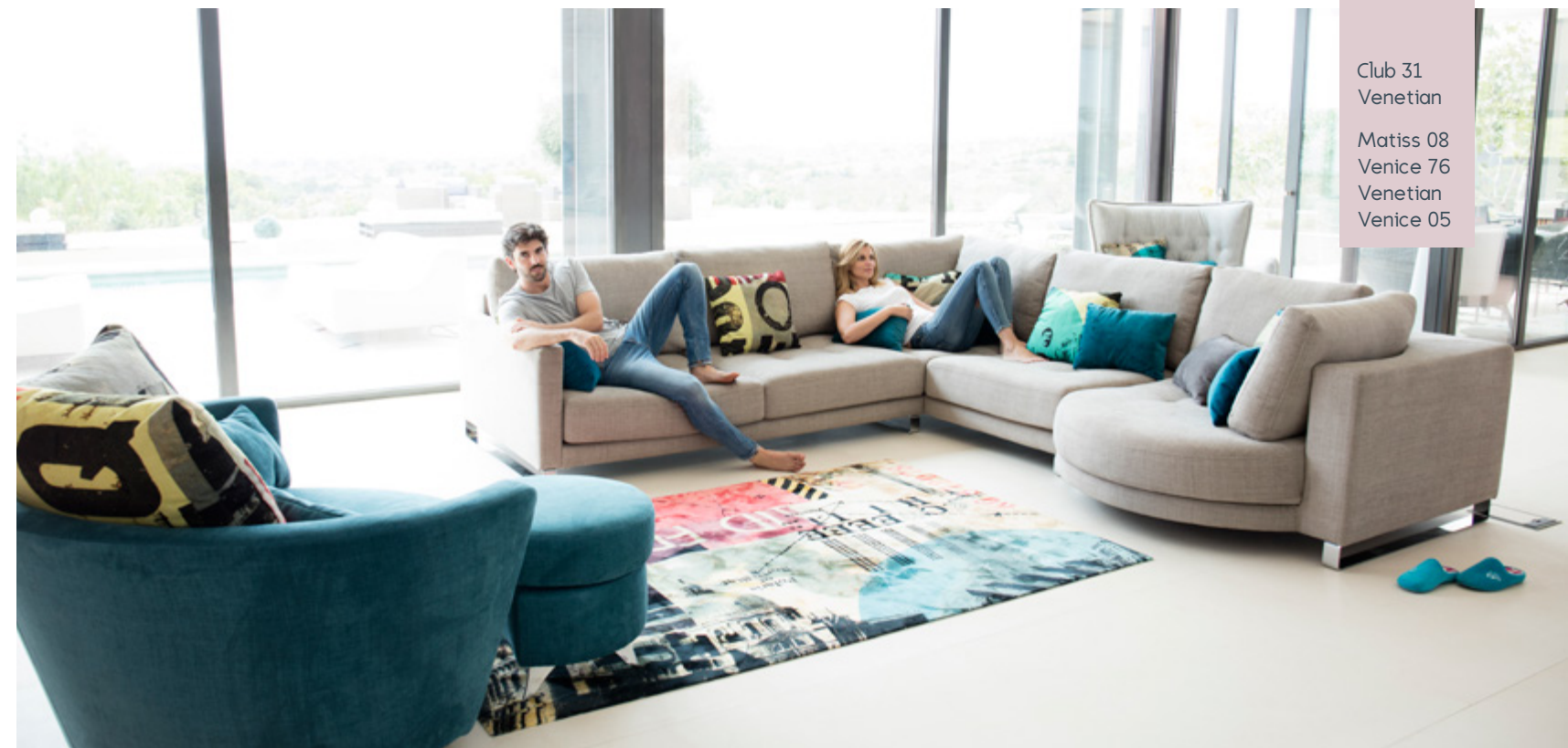
Club 31 Venetian Matisse 08 Venice 76 Venetian Venice 05