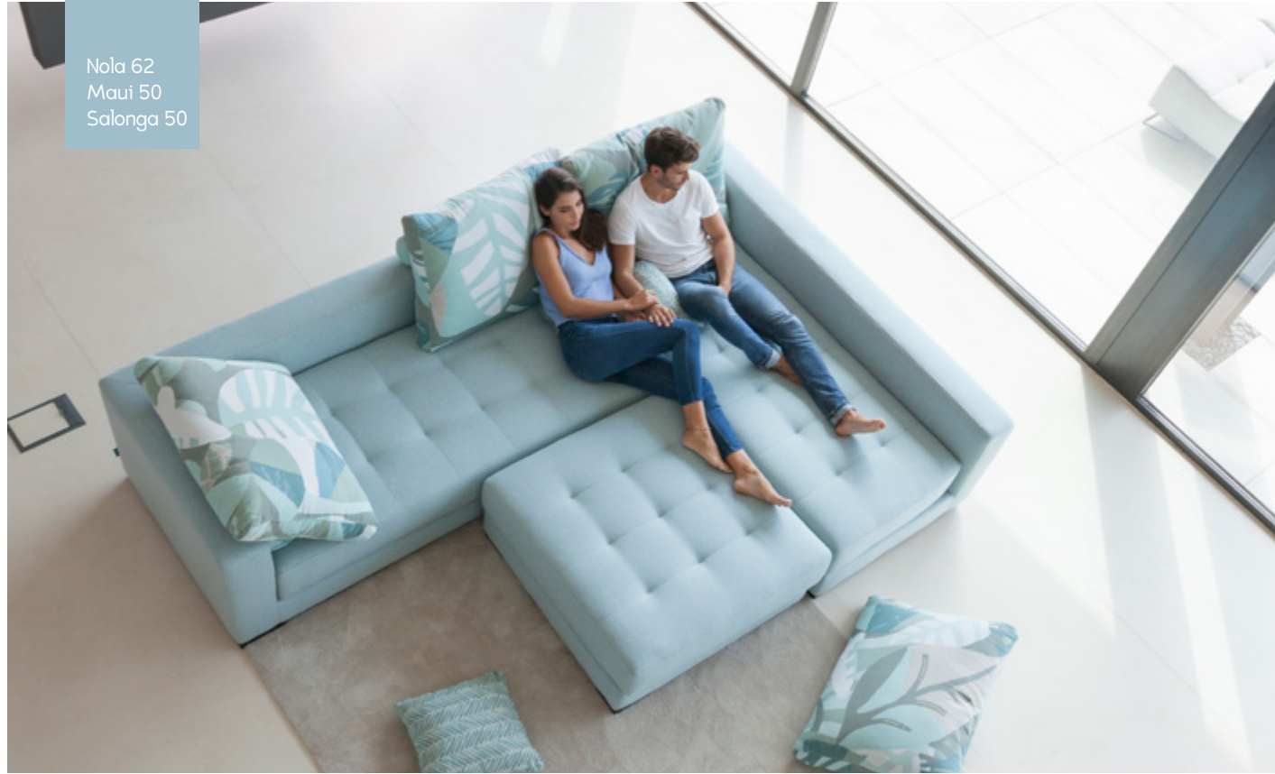
Nola 62 Maui 50 Salonga 50