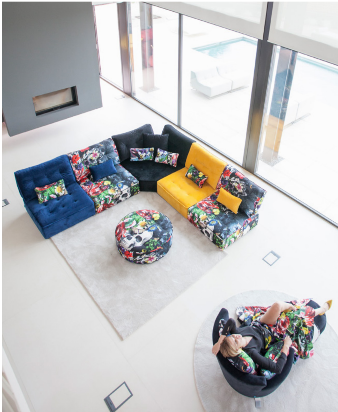
Venice 29 - Supernatural - Venice 32 - Venice 43 - Supernatural / Supernatural / Club 55 - Supernatural