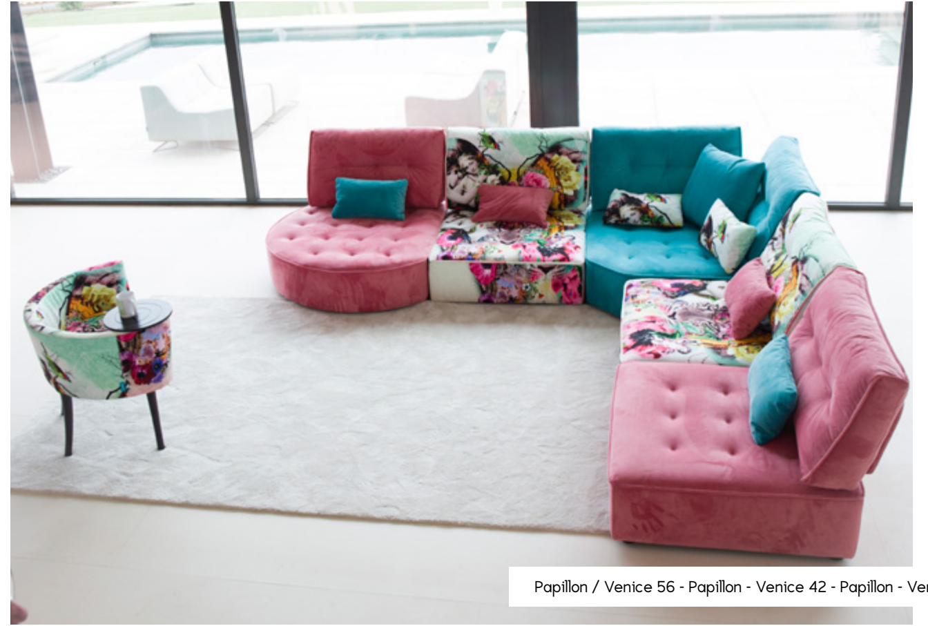
Papillon / Venice 56 - Papillon - Venice 42 - Papillon - Venice 56