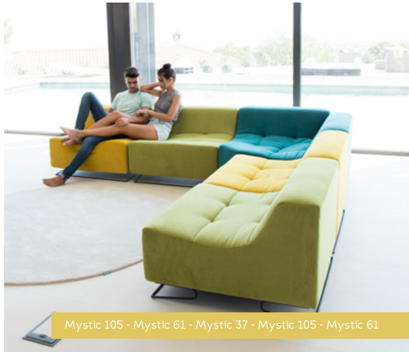
Mystic 105 - Mystic 61 - Mystic 37 - Mystic 105 - Mystic 61