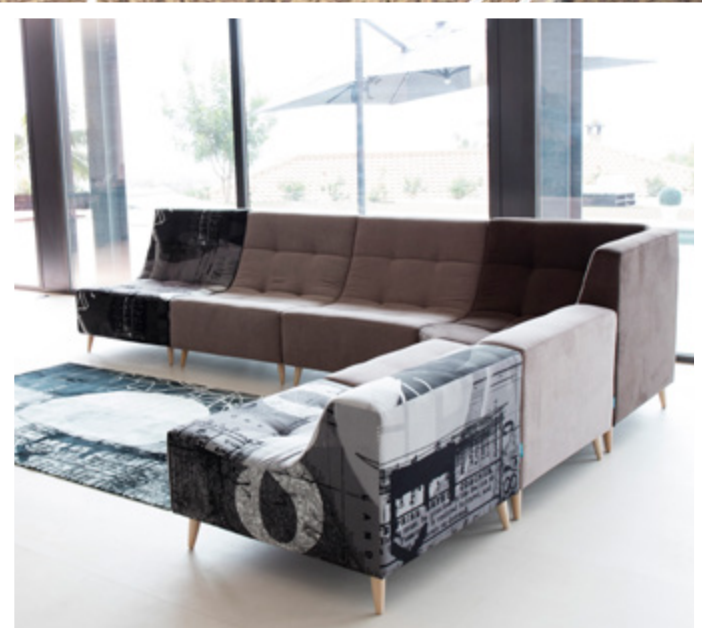
Ex - Mystic 252 - Mystic 144 - Mystic 252 - Ex