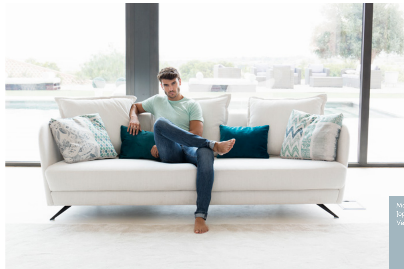
Matiss 05 Joplin 54 Venice 27