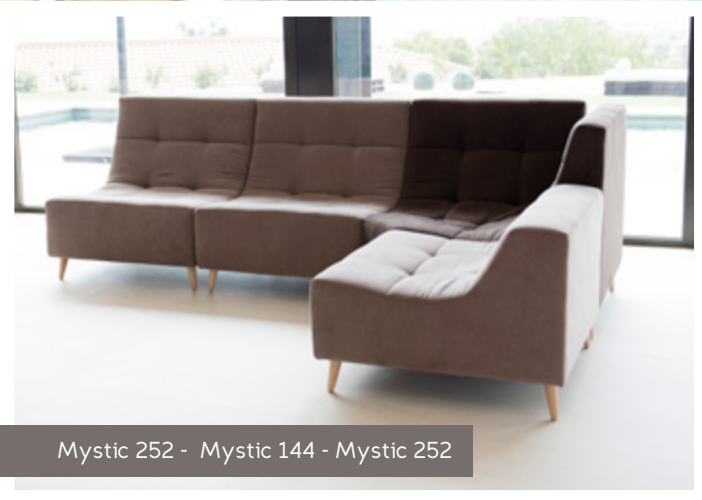
Mystic 252 - Mystic 144 - Mystic 252