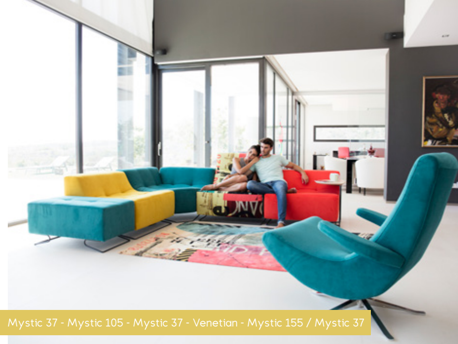
Mystic 37 - Mystic 105 - Mystic 37 - Venetian - Mystic 155 / Mystic 37