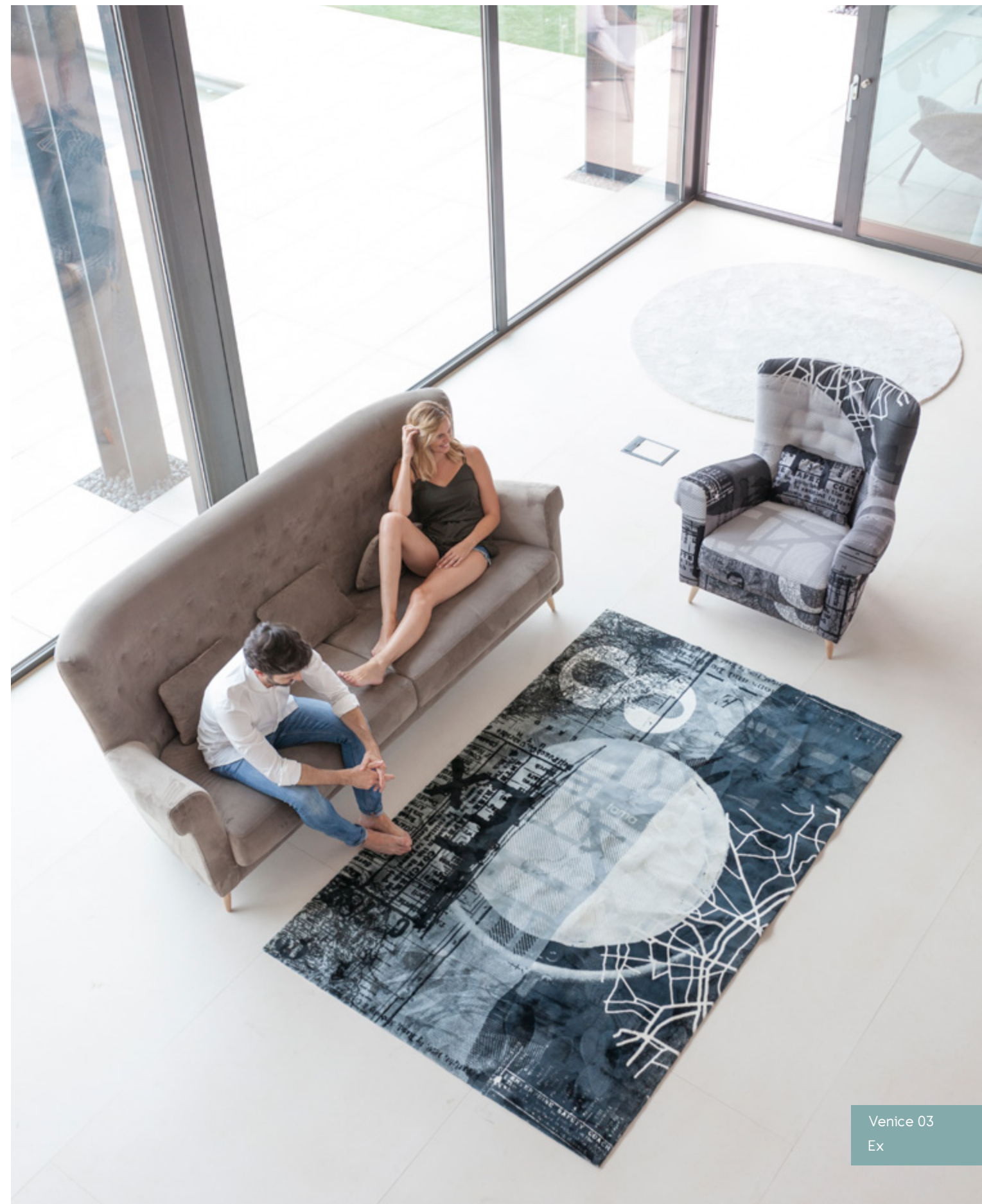
Venice 03 Ex