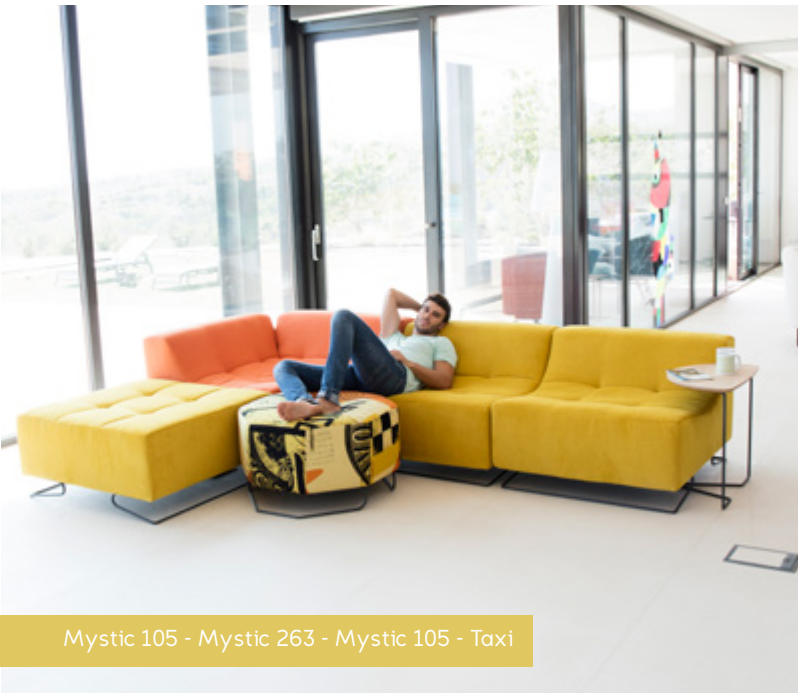
Mystic 105 - Mystic 263 - Mystic 105 - Taxi