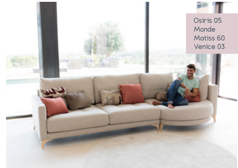
Osiris 05 Monde Matisse 60 Venice 03