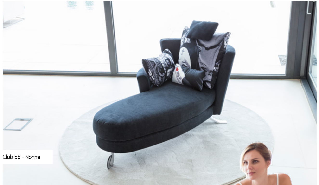
Club 55 - Nonne