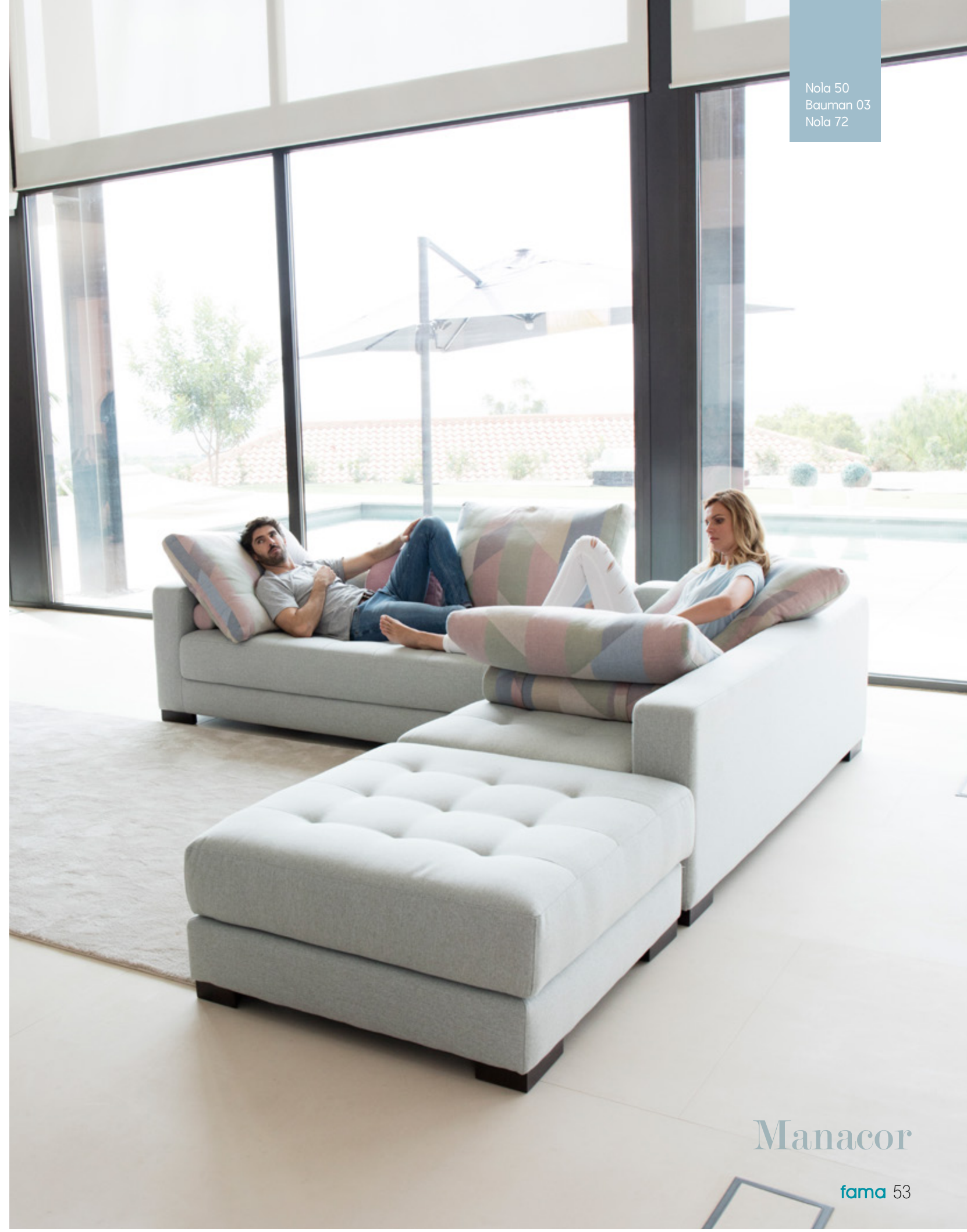
Nola 50 Bauman 03 Nola 72