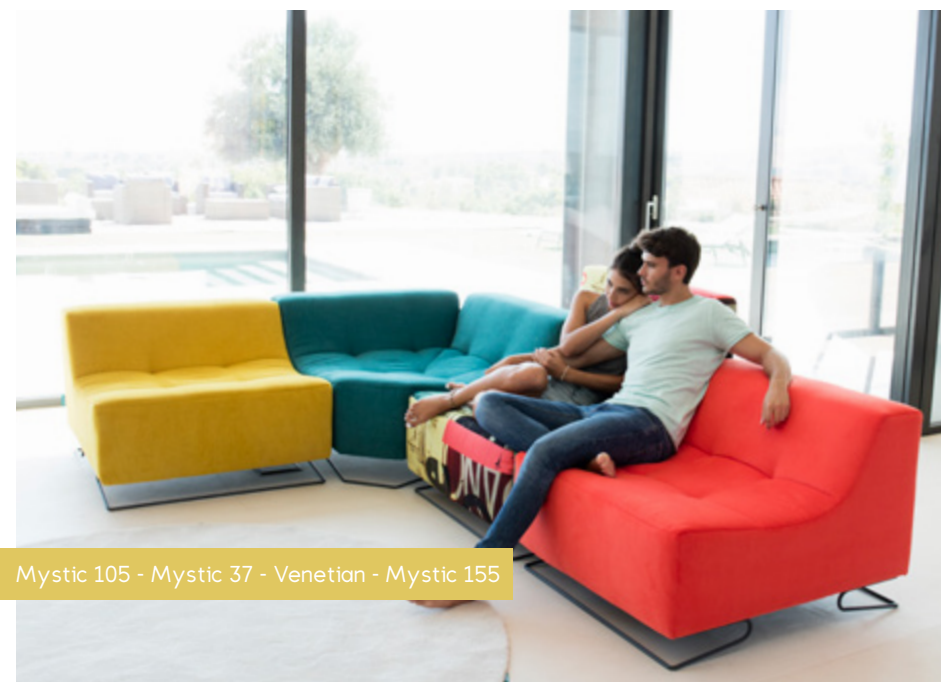
Mystic 105 - Mystic 37 - Venetian - Mystic 155