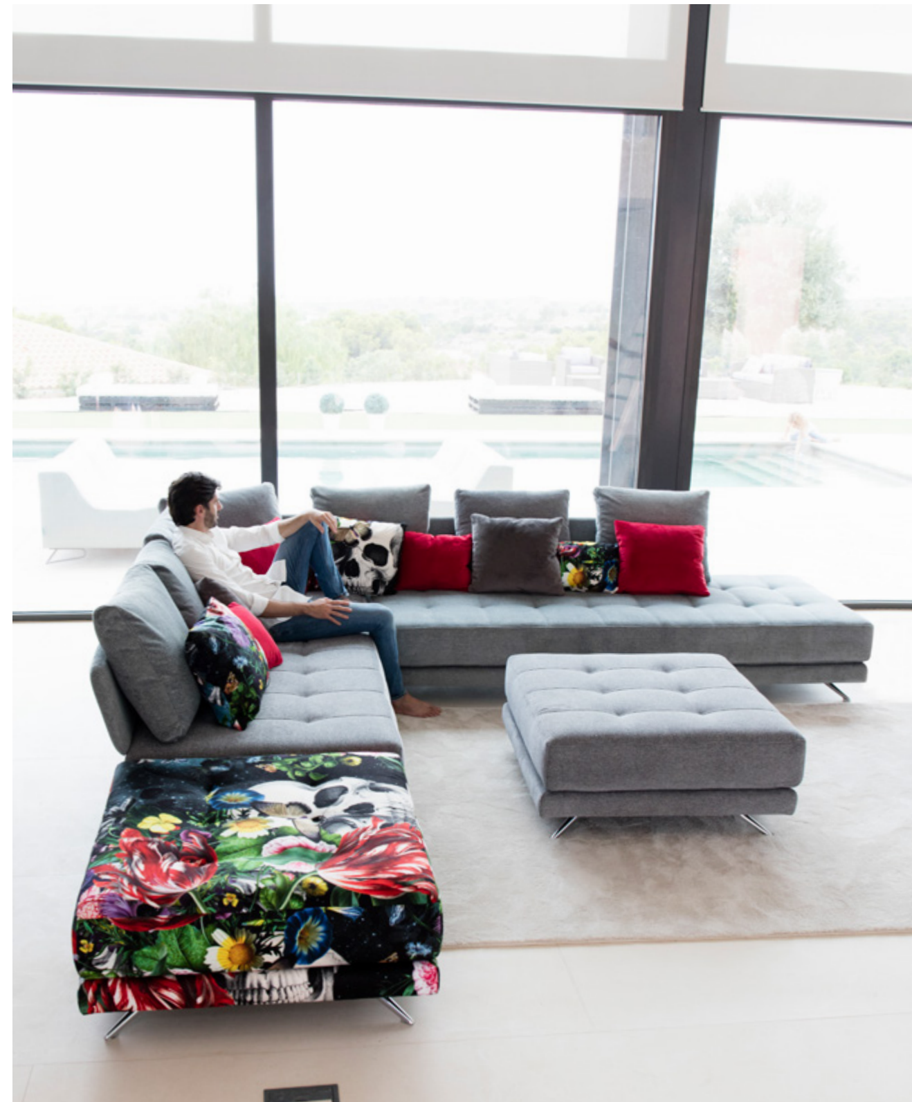
Supernatural - Voyage 271 - Supernatural - Venice 30 - Venice 05